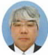
近藤 義和 (神社)