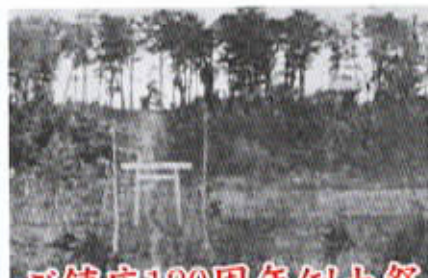
ご鎮座120周年例大祭